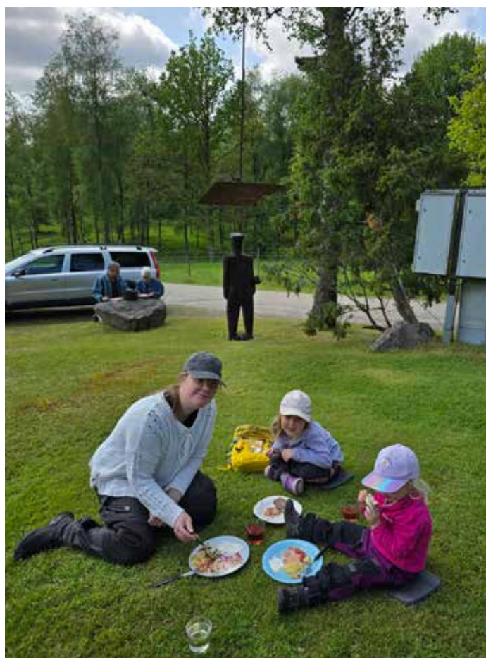
Vid huvudrätten kom det några till, som skulle gå med på resten av vandringen.