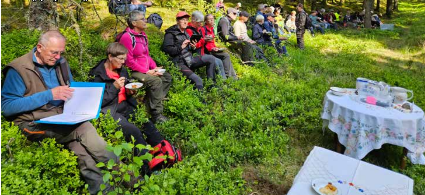
Foto: Erika Andersson Nu var vi efter en hel dags fantastisk vandring i försommarens skira grönska, tillbaka vid utgångspunkten och där väntade äntligen kaffet. Alla sat sedan och njöt i kvällssolens sken och verkade nöjda, glada och kanske lite trötta också.

Foto: Erika Andersson - Efter maten i Brostorp Lilla, fortsatte vi till Brostorp Stora och vidare in i skogen och så småningom kom vi fram till den här fina platsen, där det för länge sedan låg ett gammalt soldatorp som hette Kråketorpet. Här hade våra duktiga medhjälpare dukat upp för efterrätten mannagrynspudding med saftsås.