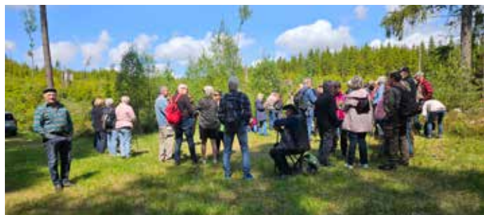
Här har vi kommit fram till förrätten som serverades strax intill Flybro. Det är en banvaktstuga, som ligger utmed banvallen av den gamla smalspåriga järnvägen (Pyttebanan), som gick mellan Falkenberg-Limnared.