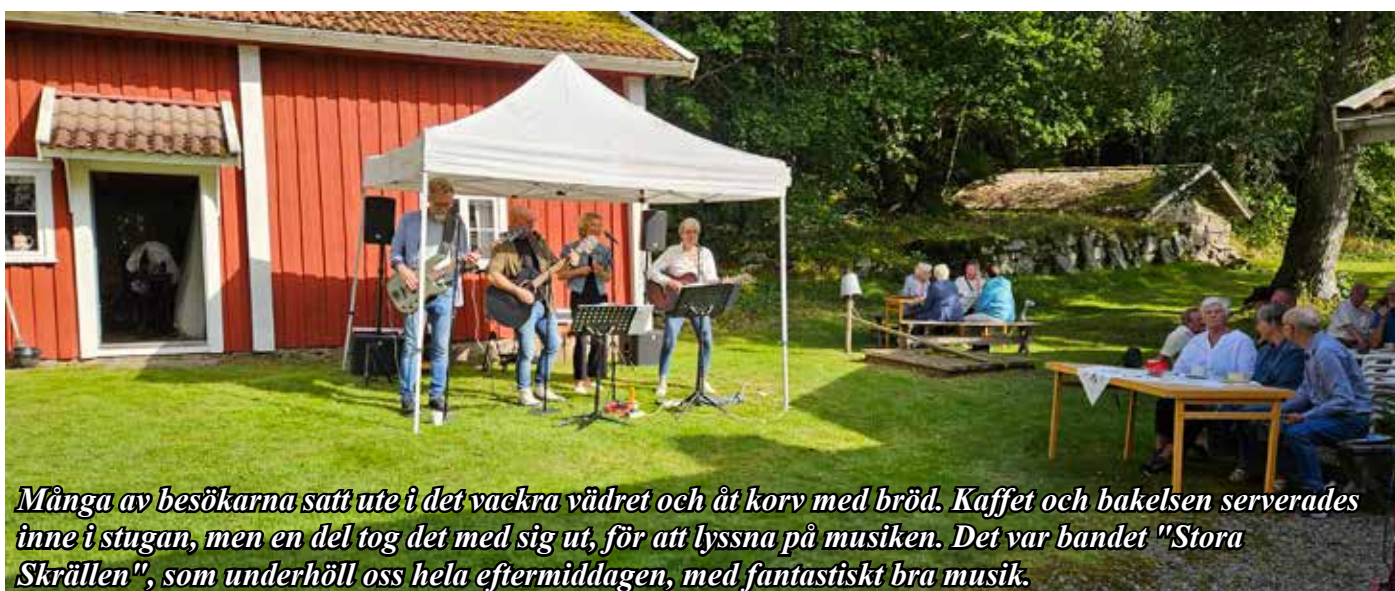
Många av besökarna satt ute i det vackra vädret och åt korv med bröd. Kaffet och bakelsen serverades inne i stugan, men en del tog det med sig ut, för att lyssna på musiken. Det var bandet "Stora Skrällen", som underhöll oss hela eftermiddagen, med fantastiskt bra musik.