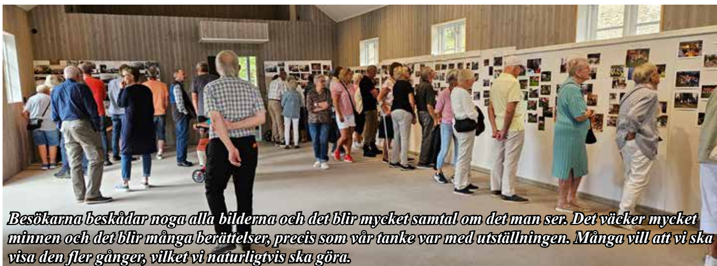
Besökarna beskådar noga alla bilderna och det blir mycket samtal om det man ser. Det väcker mycket minnen och det blir många berättelser, precis som vår tanke var med utställningen. Många vill att vi ska visa den fler gånger, vilket vi naturligtvis ska göra.